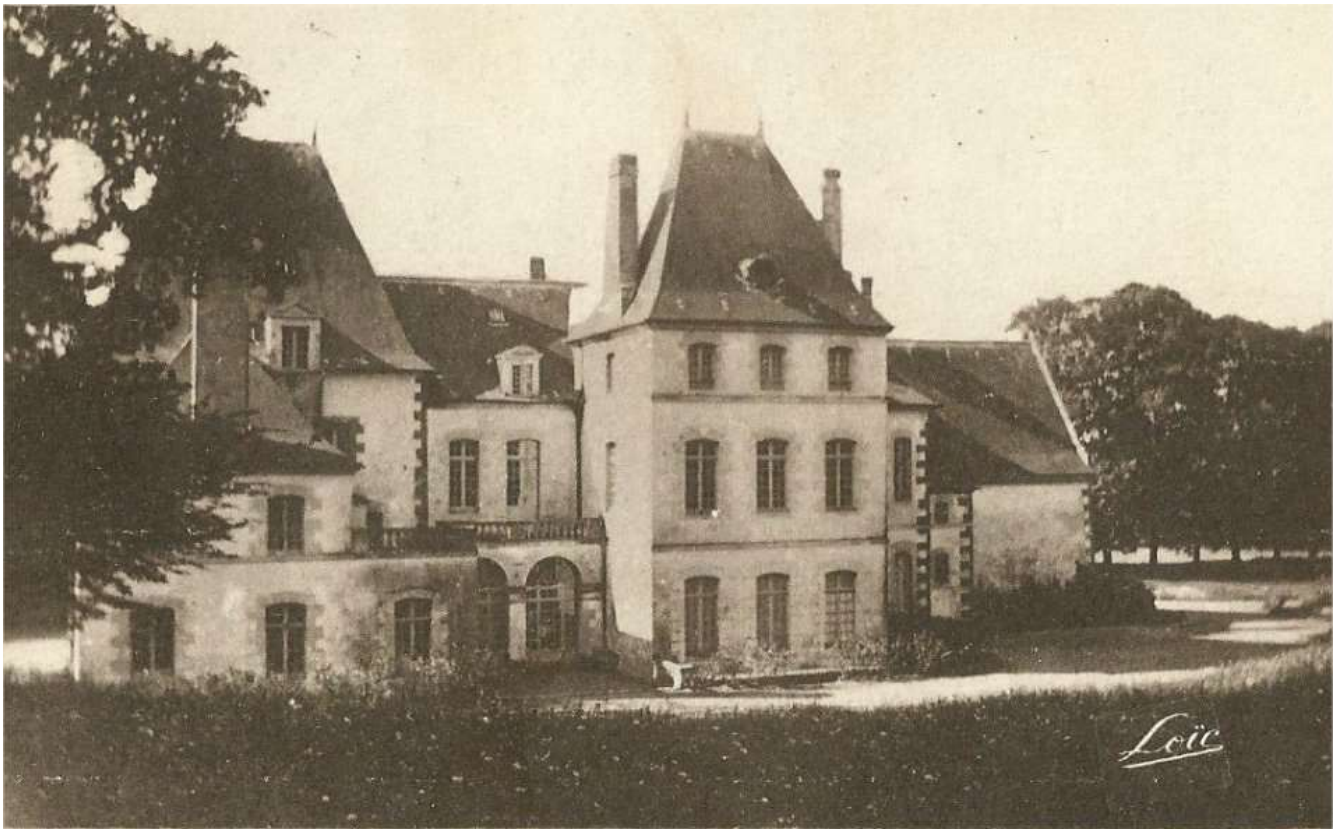
Château du verger au Coq