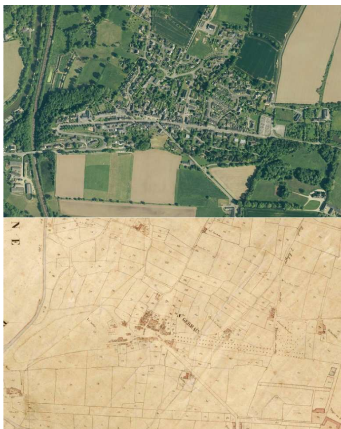
Le cadastre napoléonien, Photographie aérienne

Malgré sa petite taille, Saint-Germain a un patrimoine historique riche dont les traces persistent au travers d'un patrimoine bâti important mais aussi d'un patrimoine paysager lié au relief, aux domaines, aux activités du canal, aux carrières et à l'arrivée du train.