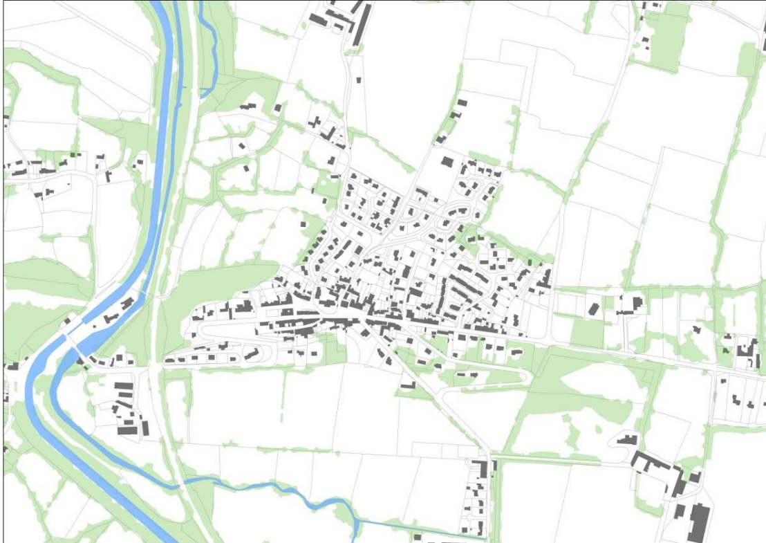
La partie agglomérée

corniche qui donna lieu à cette forme urbaine en « village-rue » contrairement à la plupart des bourgs locaux qui trouvent leurs origines aux croisements d'axes de circulations (routes de marchés). À Saint-Germain, le tracé des routes a évolué entre l'implantation des premiers ponts avant le creusement du canal puis la construction des écluses qui ont orienté les points de franchissement et de circulation (Fresnay).