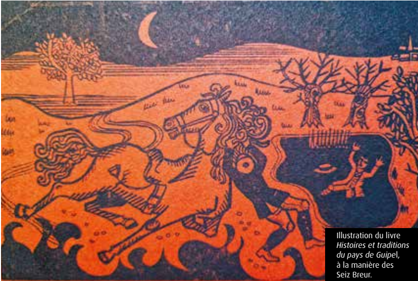
Illustration du livre Histoires et traditions du pays de Guipel , à la manière des Seiz Breur.