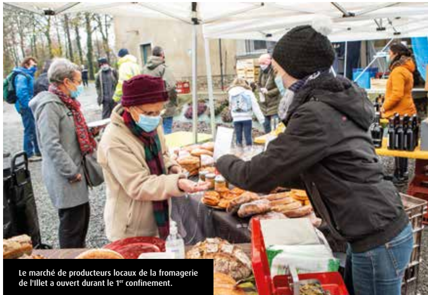
Le marché de producteurs locaux de la fromagerie de l'Illet a ouvert durant le 1 er confinement.

Le confinement a soudé les rangs. La solidarité a joué à plein. « Nous avons invité des voisins qui n'écoulaient plus leurs produits à cause de la fermeture des bars-restaurants. Nous ne prenions aucun risque à ne rien faire. Mais nous ne voulions pas rester les bras croisés ».