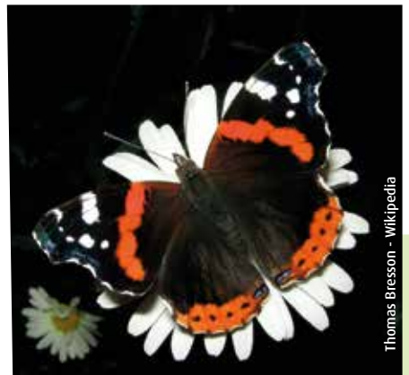
Thomas Bresson - Wikipedia

Cet hiver, 20 km de haies seront plantées grâce à l'implication d'agriculteurs, d'habitants, de commune et d'écoles.