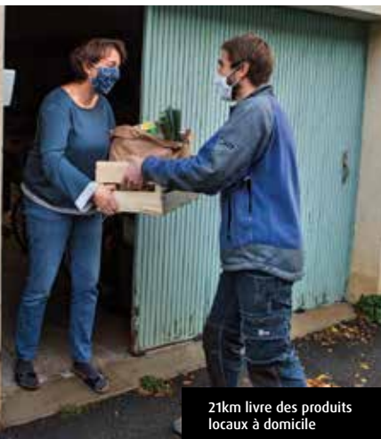
21km livre des produits locaux à domicile

Nous cofinancions les dispositifs d'aide économique de la Région Bretagne, le fonds Covid-résistance et le PASS Commerce & artisanat. Nous doublons la subvention accordée aux créateurs d'entreprises depuis le 1er janvier 2020. Nous faisons aussi la promotion du site www.fairemescourses.fr pour encourager la vente en ligne des produits des commerçants et artisans locaux.