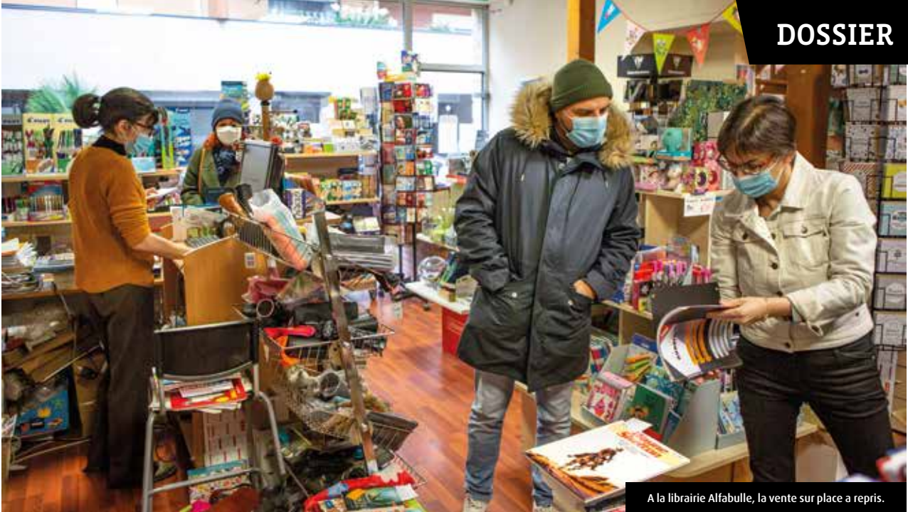
A la librairie Alfabulle, la vente sur place a repris.