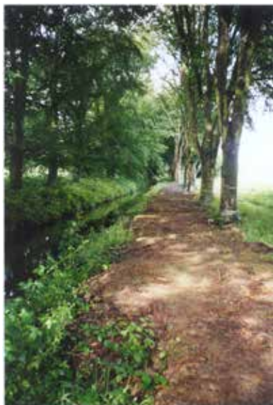
Rigole du Boulet

De plus les écluses de Villemorin et de la Ségerie sont équipées de doubles portes pour éviter en cas d'avarie la vidange de cette eau très précieuse.