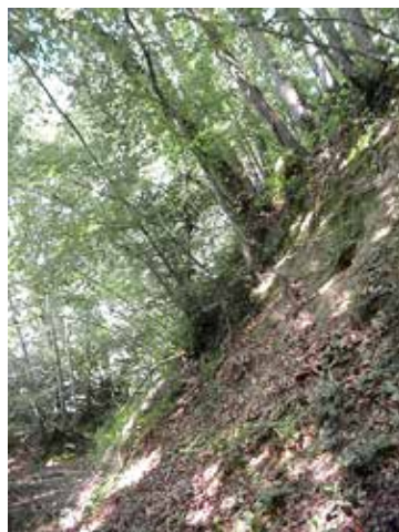
La "Motte à Madame"

La «Motte à Madame », enceinte défensive terroyée, encore présente à l'Ouest du bois (privé), date sans doute du 11ème siècle. De nombreuses pierres indiquent qu'elle devait contenir des défenses maçonnées qui pouvaient abriter un logis seigneurial. Elle est défendue par une douve.