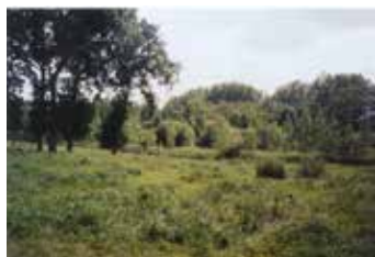
Le marais de Masse