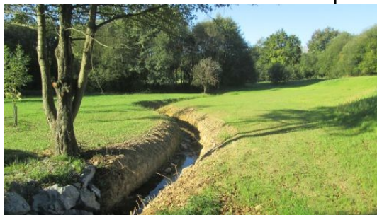
Figure 4 : zone humide du Bas Champs (secteur 1 Vignoc), restaurée par le syndicat de bassin versant de la Flume