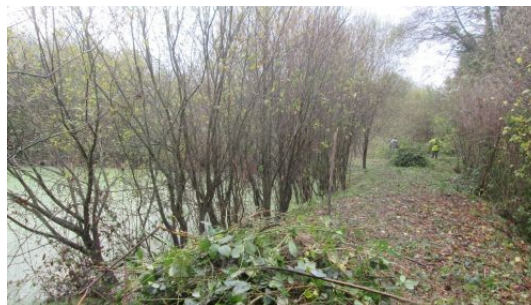
Figure 3 : lagunes de Vignoc pendant les travaux d'aménagement (sept 2015)