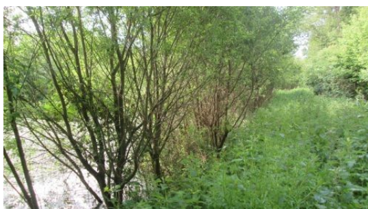
Figure 2 : lagunes de Vignoc avant les travaux d'aménagement (juin 2015)