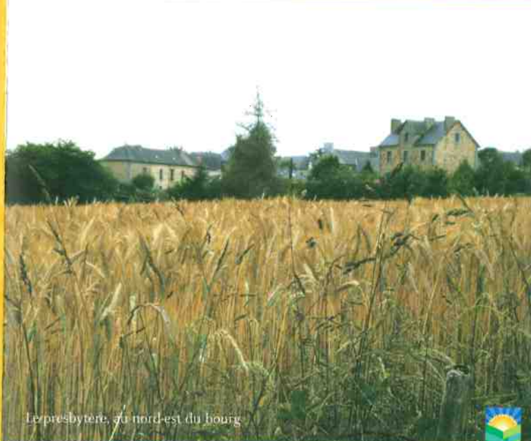
Le presbytère, au nord-est du bourg