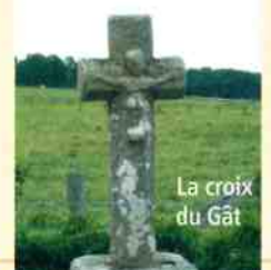
La croix du Gât