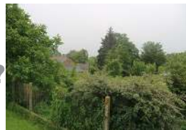
Place du marché, rue des écoles