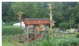
Jardins partagés, Rue de Chasné