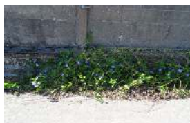
Rue de Chasné

Mots clés : imperméabilisation des sols, insectes butineurs