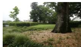
Impasse du jardin