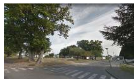
Aire de jeux, Allée d'Aquitaine,